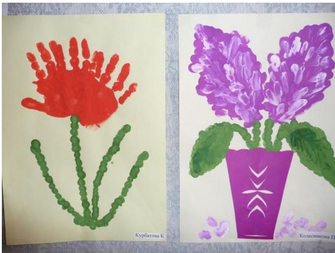
„ Букет квітів”