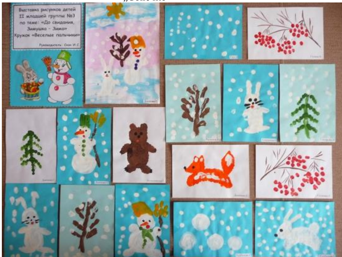
„Кетяг калини”, „Сніговик”, Ялинка”, „Снігова баба у нашому дворі”