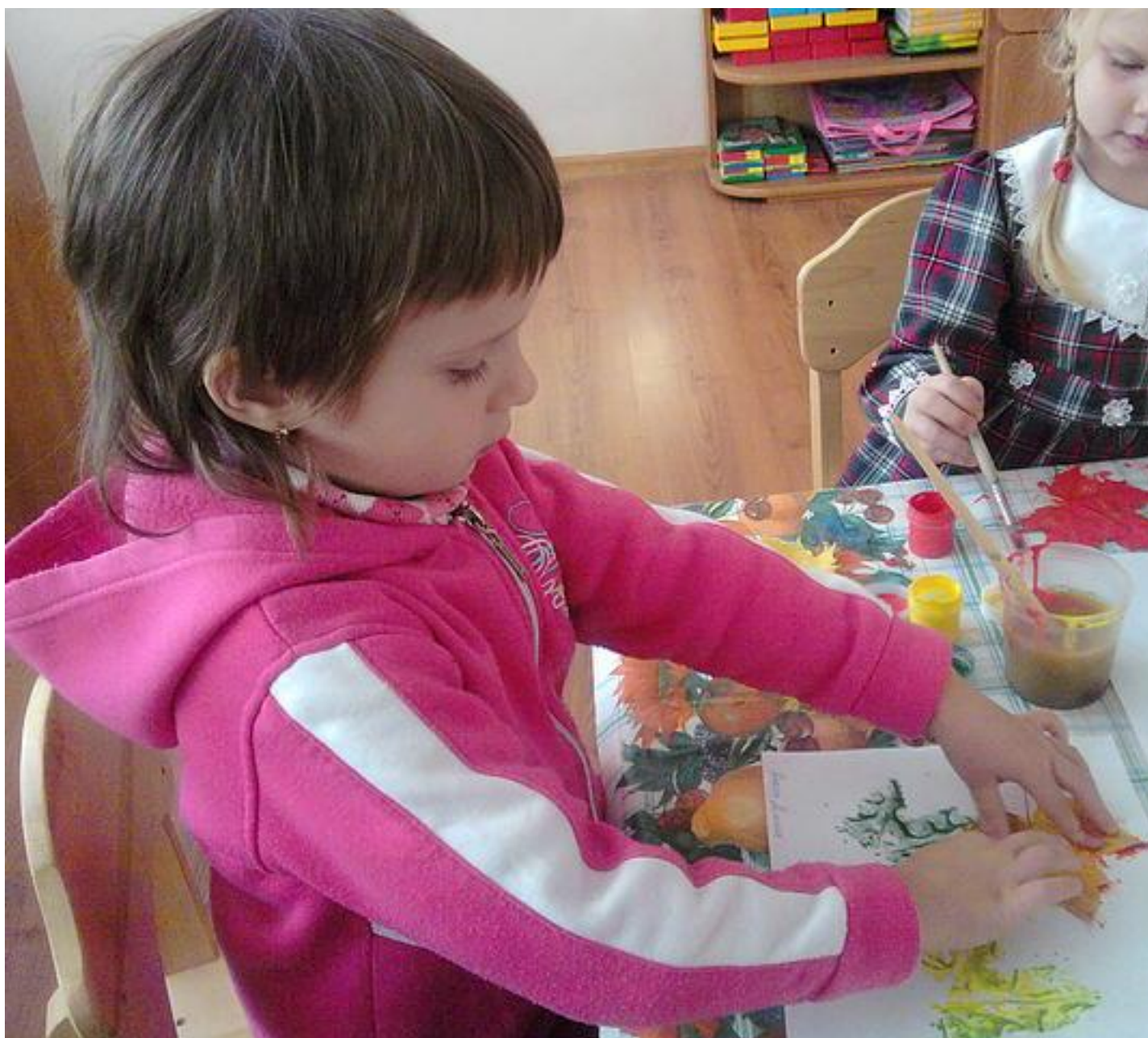
Екібана з осіннього листя